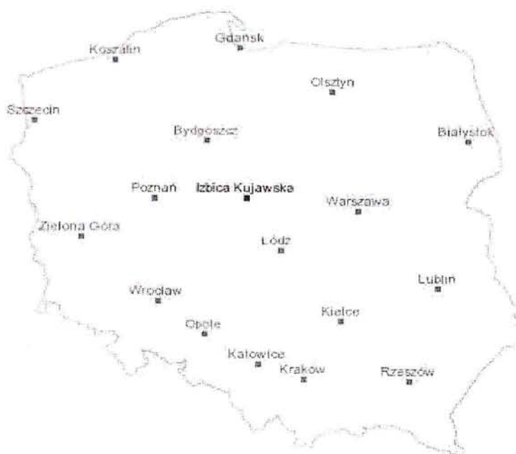
Rysunek 1. Położenie Gminy Izbica Kujawska na tle Polski

W okresie staropolskim Izbica Kujawska należała do województwa brzesko-kujawskiego (powiat przedecki). W 1331 r. na okres kilkunastu lat zagarnął ją Zakon Krzyżacki. W 1793 r. znalazła się pod panowaniem pruskim, w departamencie poznańskim i powiecie kowalskim. Po utworzeniu Księstwa Warszawskiego weszła do departamentu bydgoskiego (powiat kowalski). W Królestwie Polskim (1815-1837) miasto należało do województwa mazowieckiego i obwodu kujawskiego. W 1844 r. powstała gubernia warszawska. Od tego momentu miasto znajdowało się w guberni warszawskiej, w powiecie włocławskim. Od 1866 do 1914 r. miasto (zdegradowane po 1870 r. do osady) znajdowało się w guberni kaliskiej, w powiecie kolskim. W czasach Drugiej Rzeczypospolitej, do 1938 r. Izbica Kujawska znajdowała się w województwie łódzkim i powiecie kolskim. Następnie, wskutek reorganizacji